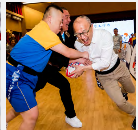
▲ 首創共融檯球，連結主流特殊學生同心同樂。