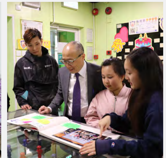
▲ 到訪青年中心，為年輕一代加油。