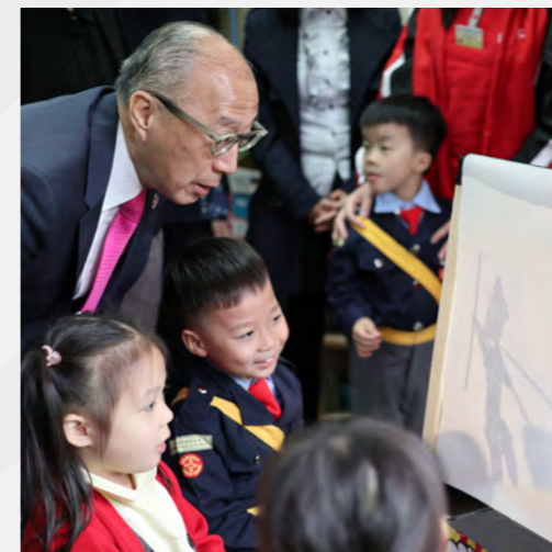
▲ 與學生一起欣賞皮影戲，同歡樂同學習。