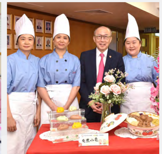
▲ 「回味」流心軟餐，以創新為吞嚥困難患者調製細心滋味。