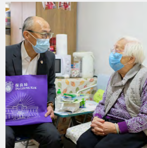
▲ 疫情之下，身體力行製備派送防疫包，支援弱勢社群。