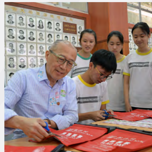
▲ 賣旗日圓滿完成，感激大眾市民慷慨支持。