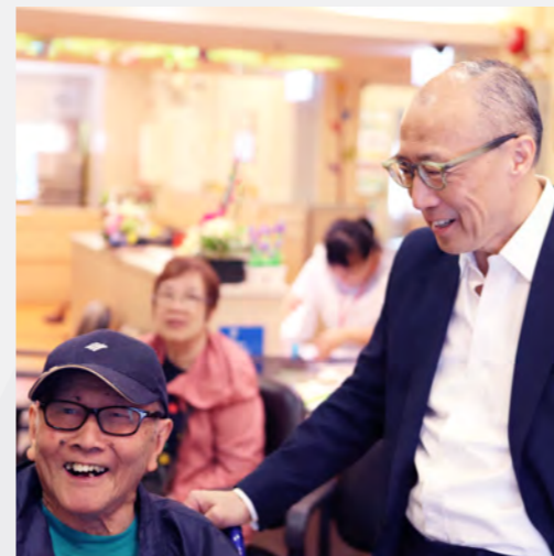
▲ 探訪安老單位，與長者交流笑談。