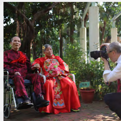
▲ 擔任攝影師，為老夫婦補拍婚照，見證真愛。