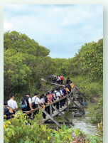
生物科及地理科：米埔自然保護區紅樹林生態考察