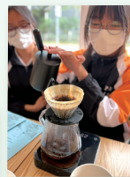
升學及生涯規劃組：於將軍澳新都城咖啡餐飲職場參觀及體驗