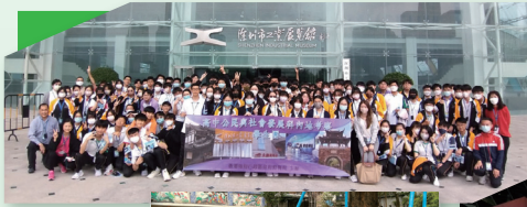
深圳市工業展覽館大合照

於復活假期間，本校中五級共121位師生率先參加了教育局「深圳創新科技發展及文化保育內地考察」，學生親身體驗中華文化及親歷國家最新發展和成就。學生透過考察深圳市工業展覽館、深圳改革開放展覽館及甘坑客家小鎮，深入探討深圳創新科技產業的發展概況，以及國家保育及傳承文化遺產的工作，並反思個人或香港可在國家經濟發展上掌握的機遇及維護文化安全的重要性。