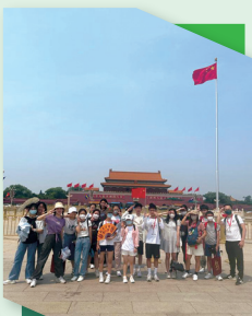
到天安門觀賞升旗禮