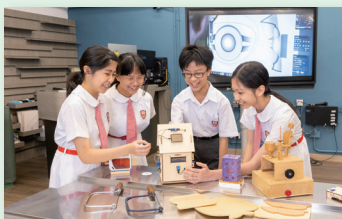
第二期設計與科技室

本校一向著重培養學生的創意思維，隨著學生對創新科技知識的提升，本校亦在硬件上提供配套，第二期設計與科技室接近竣工，期望日後能讓學生在STEAM課程發展及比賽上更上一層樓。於上學年，有蓋操場已加裝摺門及小講台，現正翻新地板及加裝冷氣，除了讓學生有更舒適的環境用膳及上課外，更可以舉行午間演唱會等活動，促進師生關係，讓學生盡情享受校園生活。