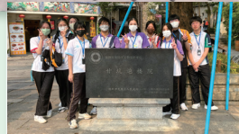
同學參觀甘坑客家小鎮