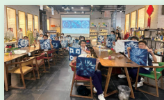
體驗中華文化—茶染