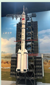
認識中國航天科技