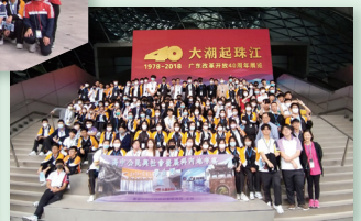
深圳改革開放展覽館大合照