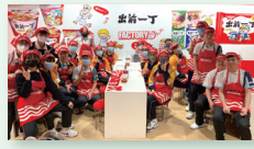
化學科：於合味道紀念館認識食品安全和處理

培養學生的自主學習能力是本校關注事項之一，本校於疫情後隨即舉辦「全方位學習日」，帶領全校學生走出校園，透過到不同地點體驗多元學科知識，鼓勵學生將學科知識與技能互相結合，促進各學科的探究式學習，激發學生的好奇心與創造力，各科組的學生更於早會時間向全校同學分享學習成果及經歷。