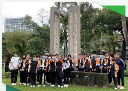
中國語文科：於香港中文大學進行文學散步—中文大學之旅